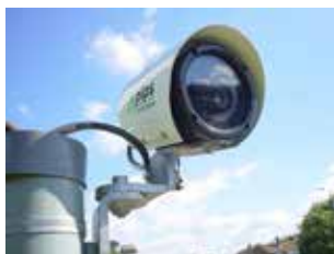
◀ De gemeente investeert in camera's om zwaar verkeer uit de dorpskernen te weren.