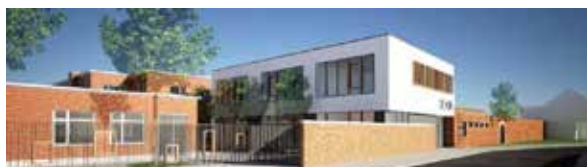
▲ De toekomst ziet er mooi uit voor De Kim en De Beuk.