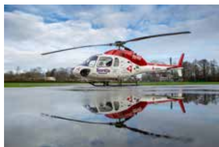
▲ De MUG-Heli redt jaarlijks tientallen mensenlevens en is de steun van onze gemeente dus zeker waard.

N-VA Deerlijk wil CD&V herinneren aan haar verkiezingsbelofte om geld vrij te maken voor de MUG-Heli. De MUG-Heli redt jaarlijks tientallen levens en is dat geld meer dan waard.